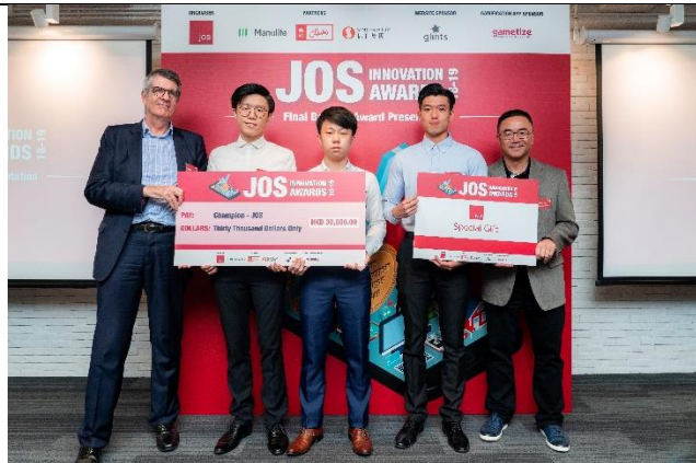
照片三：宏利代表、JOS 代表與勝出隊伍 Smart-L