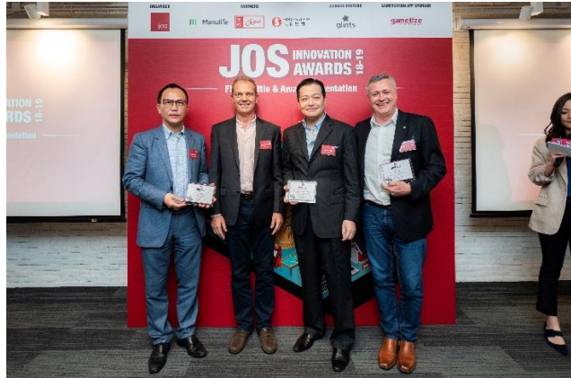
照片二：JOS 代表與勝出隊伍 Pioneer