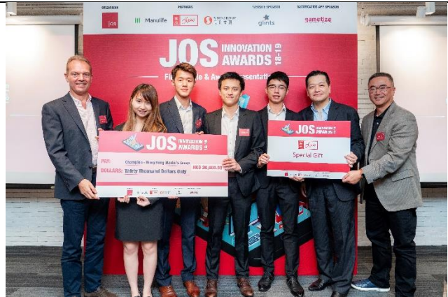
照片五：信和集團、JOS 代表與勝出隊伍 Sporty Teens